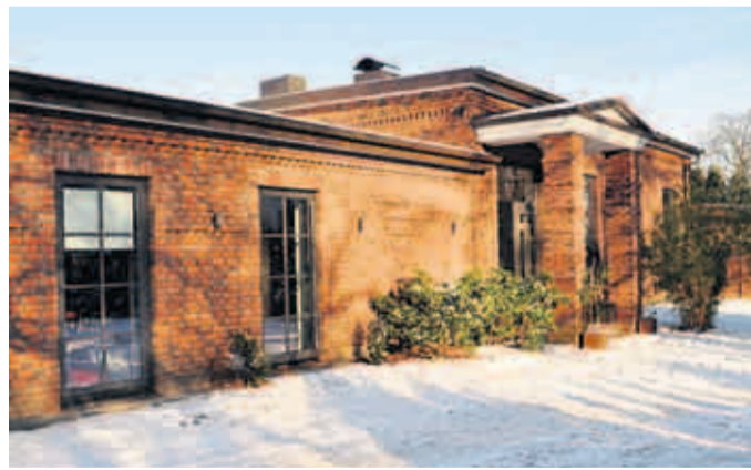
Seitenansicht des Braaker Hauses, das mit acht Zimmern und insgesamt 400 m 2 Wohnfläche viel Platz bietet.

Das Haus ist sehr solide gebaut. „Die Dämmung ist ziemlich optimal und kommt einem Niedrigenergiehaus sehr nahe“, sagt Architekt Mecklenburg und verweist dabei auf die neu gezogene Fenster und das mehrfach gedämmte Dach. „Wir wohnen jetzt zwei Jahre hier, und wir würden alles genauso wieder machen“, sagt das Unternehmerpaar. Das liebevoll gestaltete Luxus-Zuhause steht zum Verkauf. Der Kaufpreis liegt bei 1,49 Millionen Euro.