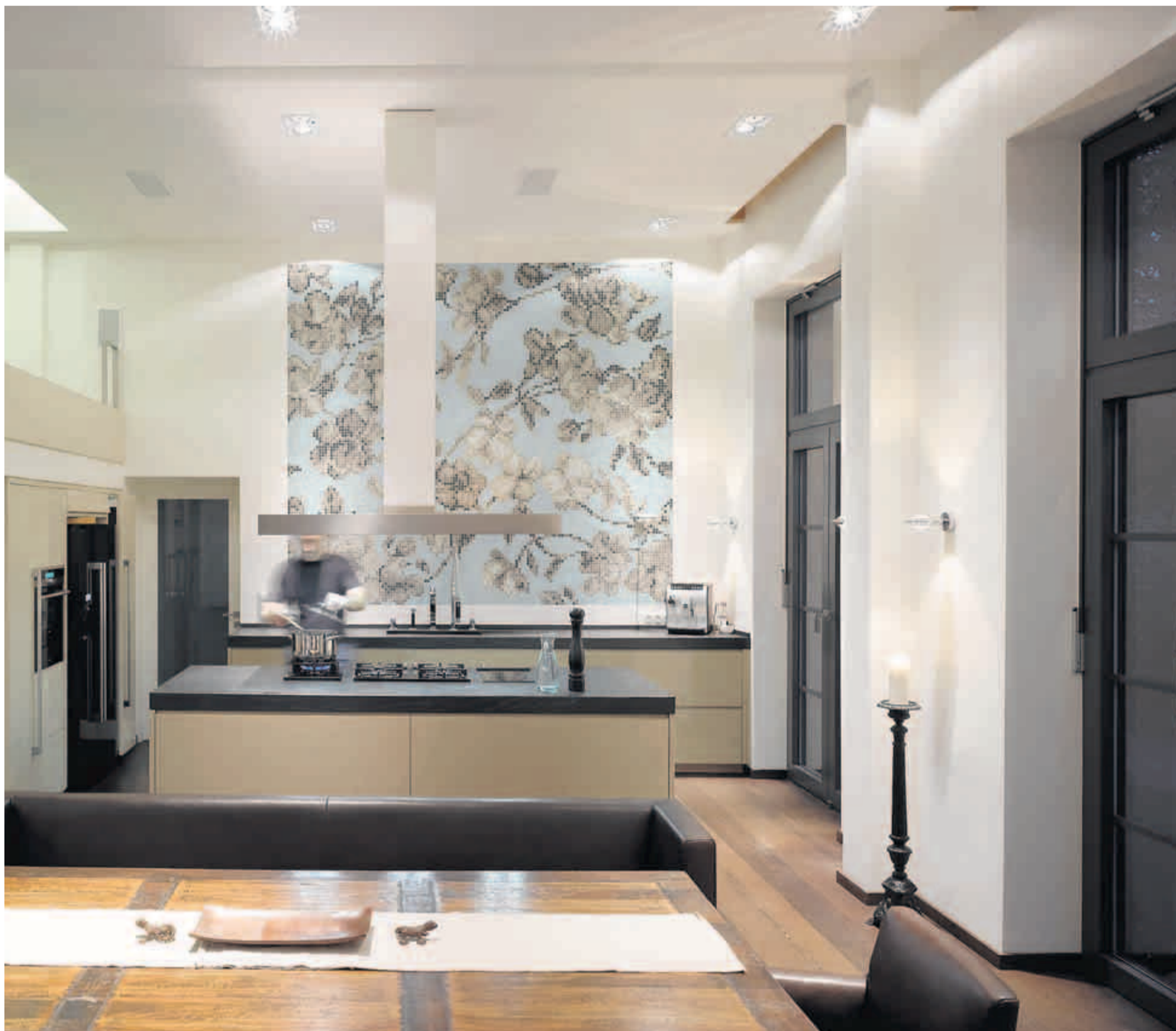
Blick auf die offene Luxus-Design-Küche in der vier Meter hohen Wohnhalle. Im Hintergrund die Mosaikwand aus recyceltem Glas des italienischen Herstellers Bisazza.

„Jedes Detail, jede Schublade haben wir zu dritt diskutiert“, beschreibt Ulf Berger den Prozess bis zur Vervoll-