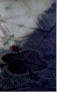
essins, die auf