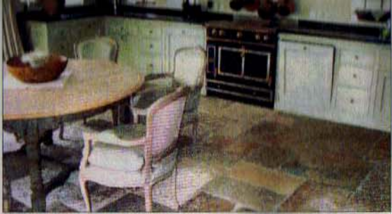
Naturstein „Burgunder“, von Marmor Möller extra bearbeitet, um die raue, alte Optik herzustellen.

lichen Gebäuden oder Restaurants verwendet wurde. Zementmosaik hingegen besteht aus weißem Zement, Marmor- mehl und Farbpigmenten, manche Hersteller wie etwa Mosaico (www.zementfliesen.com) mischen noch Sand und Felsgranulat hinzu. Für die Muster verwenden die Fliesenmanufakturen Schablonen aus Metall, mit denen sie die Farben trennen und setzen diese in einen Rahmen, bevor die Fliese in die hydraulische Presse