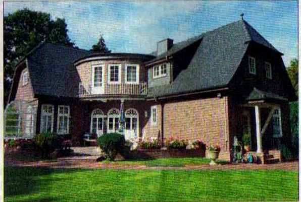
Ein herrschaftliches Anwesen mit neun Zimmern und einem Parkgrundstück von 4300 Quadratmetern.

Wenige Schritte vom Herrenhaus entfernt befindet sich das Zweithaus, das derzeit im Erdgeschoss mit 274 m 2 als Firmensitz mit 15 Arbeitsplätzen genutzt wird. Das Obergeschoss des Hauses bietet auf weiteren 100 m 2 eine Einliegerwohnung mit separatem Eingang. Vor dem Haus befinden sich ein Carport und insgesamt zehn Pkw-Stellplätze. „Das gesamte Objekt bietet viele verschiedene Nutzungsmöglichkeiten zum Wohnen und Arbeiten, für Ärzte, Freiberufler oder auch als Tonstudio“, sagt Makler Harald Leonhard von Leonhard Immobilien. Ein Mehrgenerationenwohnen sei ebenso denkbar wie die Vermietung der Einliegerwohnung. Die Verkehrsanbindung nach Hamburg und Lübeck ist sehr gut und der Wohnwert durch die grüne Umgebung mit Wald und Seen hoch. Der Kaufpreis beträgt 1,95 Millionen Euro. (kei)